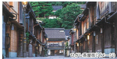
ひがし茶屋街(伊弉一)