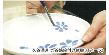
久谷満月 九谷焼絵付け体験(イメージ)