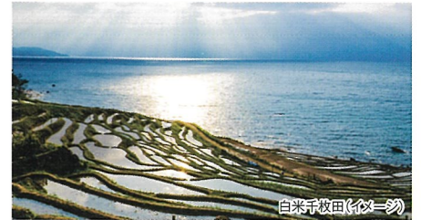
白米千枚田(イメージ)