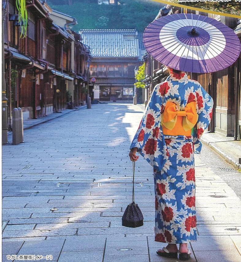
ひがし茶屋街(伊弉一)