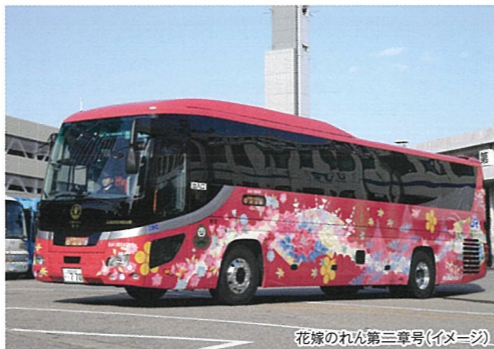
花嫁のれん第二章号(イメージ)