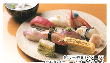
金澤玉寿司(イメージ) (当日のメニューとは異なります)