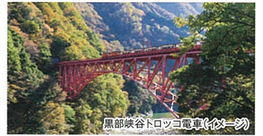
黒部峡谷トロッコ電車(イメージ)