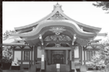
北野天満宮 宝物殿