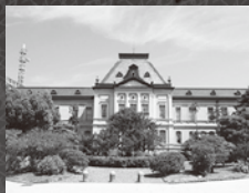
京都府庁 日本館外観