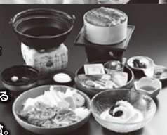
食後、琵琶による 「平家物語」の 弾き語りを鑑賞。