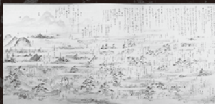
北野天満宮 宝物殿 「北野大茶湯園」