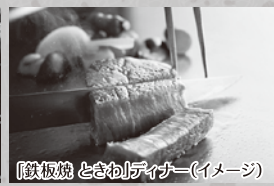
鉄板焼 とさわ! ティチャー(イメージ)

旅行企画・実施 河北新報トラベル TEL.022-211-6960 河北新報トラベル 仙台市青葉区五橋1-1-10