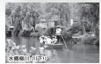
水郷柳川・川下り