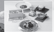
「アジアのベストレストラン50」に名を 連ねる福岡の名店シェフ監修のお料理