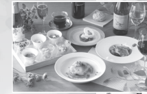
福岡を代表するシェフたちが監修し、 車内の窯を使った作りたてのお料理