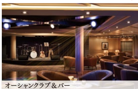
オーシャンクラブ&バー