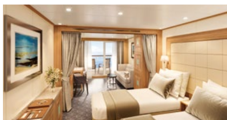
ベランダスイート[A~F] 24.4〜30.2㎡ ベランダ付 デッキ5〜10(5〜10階)