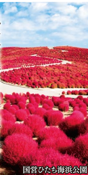
国営ひたち海浜公園