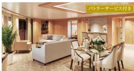
シグネチャースイート 87.0㎡ ベランダ付 デッキ7(7階)