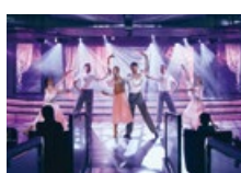
船内イベント 目の前のステージで開催される 魅力のショーやコンサート他、船 内イベント盛りだくさん。

サン ロク 三六スイート(ペントハウス以上) ご滞在のお客様のプレミアムサービス ●ウェルカムシャンパンと ウェルカムスイーツのご用意。 ●「ザ・レストラン桜」専用エリアでのお食事。 ●ダイニングルームのお食事をお部屋にお届け。 ●至れり尽くせりのパトラーサービス。 ●ランドリサービス。 ●Wi-Fiインターネット無料サービス。