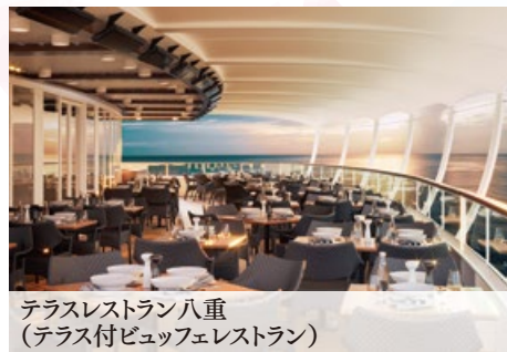
テラスレストラン八重 (テラス付ビュッフェレストラン)