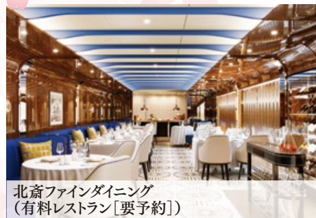
北斎ファインダイニング (有料レストラン[要予約])