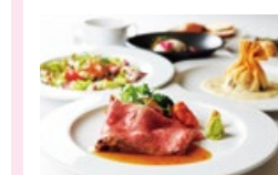
お食事代 和食はもちろん世界各国の料理 も味わえる充実のダイニング。24 時間ルームサービス。

商船三井の伝統を引き継ぐおもてなし サクラ・インクルーシブ〜旅行代金に含まれるサービス〜