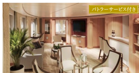
ラグジュアリースイート[A・B] 55.7〜87.0㎡ ベランダ付 デッキ6・7・8(6・7・8階)