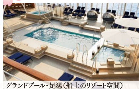
グランドプール・足湯(船上のリゾート空間)