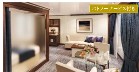
ペントハウススイート 39.7〜54.8㎡ ベランダ付 デッキ6・9・10(6・9・10階)