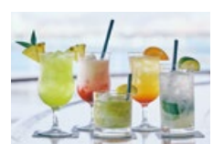
ドリンク(アルコール含む) カクテル・ワイン・ビール・ウイスキー・ソフトドリンクなど200種 類以上のドリンクフリー。