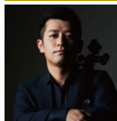
宮田 大(チェリスト) 2009年ロストロボーグ・ヴィチ国際チェロコンクールにて日本人として初めて優勝。これまでに参加した全てのコンクールで優勝。その圧倒的な演奏は、世界的指揮者・小澤征爾をはじめ多くの指揮者に絶賛され、日本を代表するチェリストとして国際的な活動を繰り広げている。

エンターテイナーのほか、三井オーシャンサクラのプロダクションショーやハウスバンドのコンサートもご覧いただけます。