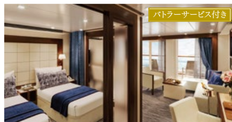
ペントハウススパスイート 48.8〜49.4㎡ ベランダ付 デッキ10(10階)