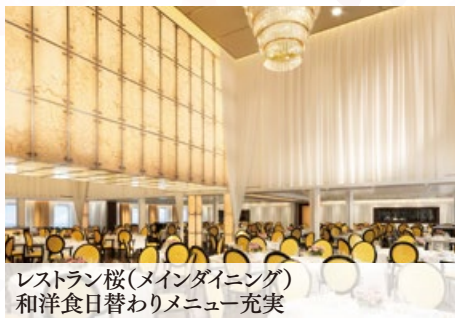
レストラン桜(メインダイニング) 和洋食日替わりメニュー充実