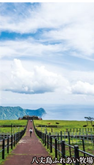
八丈島ふれあい牧場